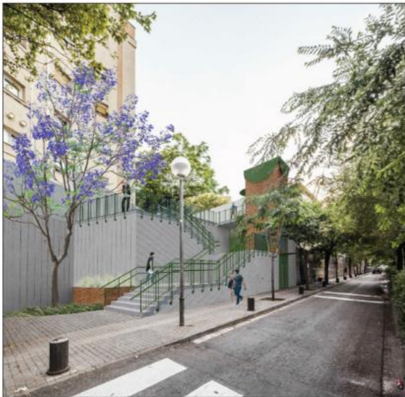
IMATGE DE PROPOSTA - NOU ASCENSOR AL CARRER DE VILA-SECA